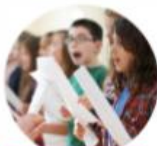
HOU JE VAN ZINGEN?