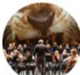
BESPEEL JE EEN INSTRUMENT?